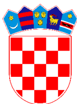
VLADA REPUBLIKE HRVATSKE Ured za udruge

Logotip je osnovni grafički element vidljivosti Ureda za udruge koji čini grb Republike Hrvatske s punim nazivom Ureda na hrvatskom i/ili engleskom jeziku: