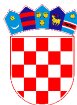
GOVERNMENT OF THE REPUBLIC OF CROATIA Office for Cooperation with NGOs